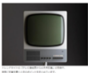
テレビ番組表からネタを探し出すタイプの記事です。

基本を覚える事で、今度は自分で様々な所から【流行】を察知し ネタを探して自由に記事を書けるようになっていきます。