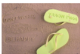
人の悩みや欲求を解決するタイプの記事です。