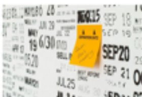
季節のイベントや行事をネタにした記事のタイプです。